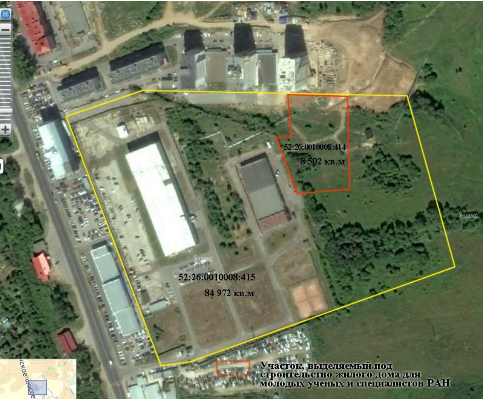
Участок, выделяемый под строительство жилого дома для молодых ученых и специалистов РАН