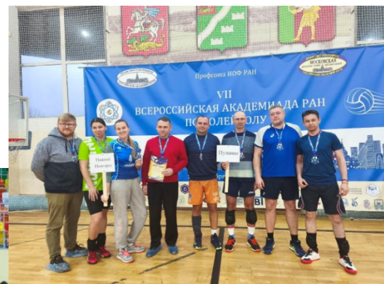
Апрелевка - 2025