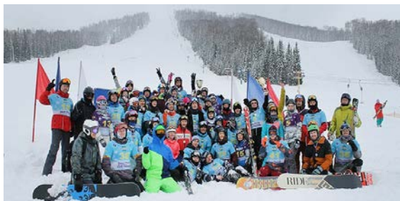
Таштагол - 2021