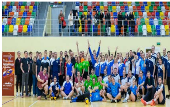
Казань - 2022