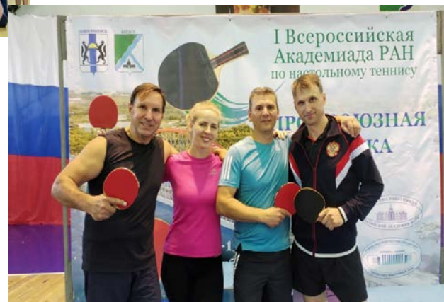
Новосибирск - 2024